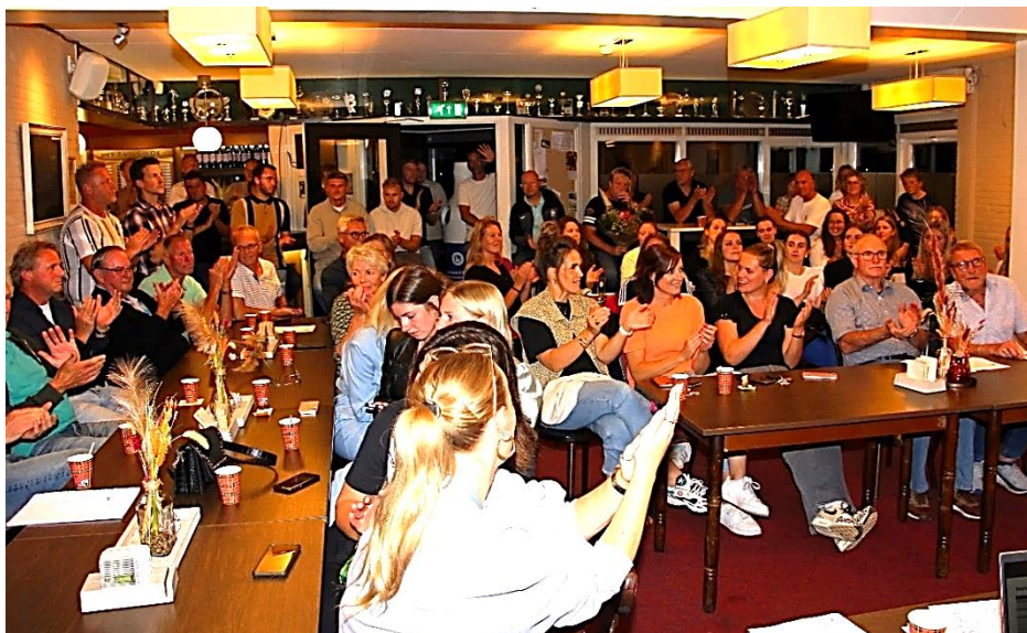
Een volle kantine geeft applaus aan de aftredende TVO bestuursleden