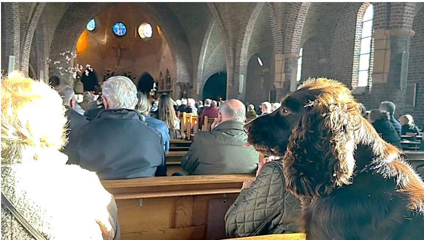
Blasiuskerk Beckum goed gevuld bij de Hubertusviering, ook met honden... (info Facebook/Beckum.nl)