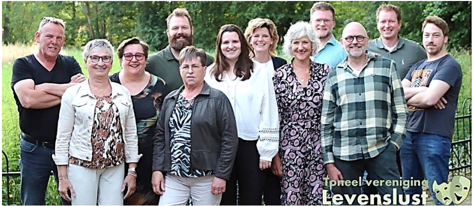
Het Levenslust team is er(bijna) klaar voor!

De zaal is een uur voor aanvang van de voorstelling open. Kaarten zijn te bestellen via onze website www.levenslust.com . De kaarten kosten € 15,00 per stuk inclusief koffie of thee.