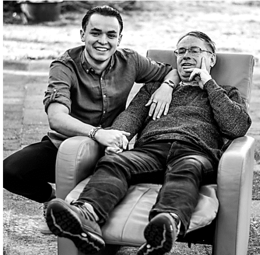
Hier worden we allemaal even stil van!!