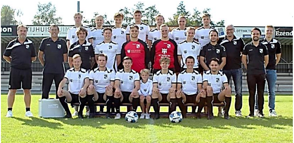
De complete TVO 1 selectie met technische staf van afgelopen seizoen 2023-2024