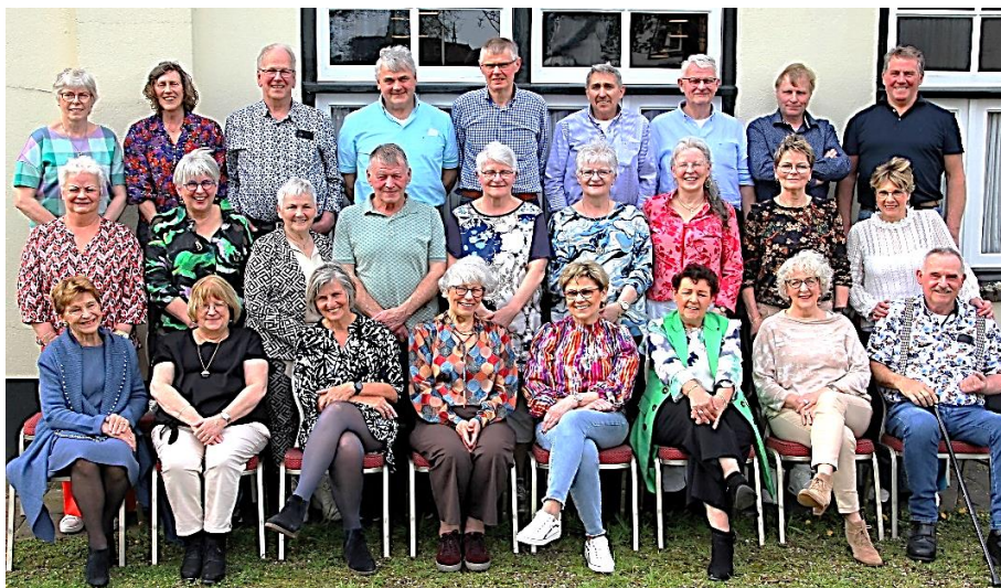
Foto van de reünie 6e klas van de basisschool Beckum, geboortedatum 1956/1957. Reünie 6 april 2024 Proggiehoes