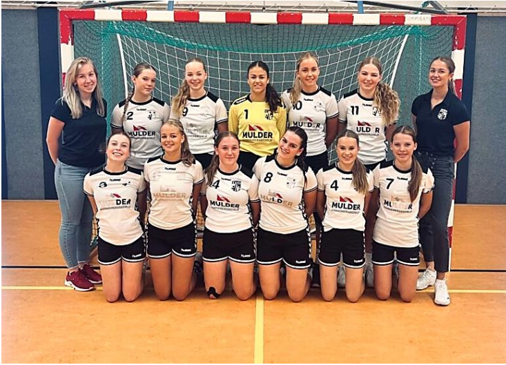
Dit hadden ze nog tegoed! De kampioensfoto van de meisjes B1 handbal na de ongeslagen behaalde titel!!