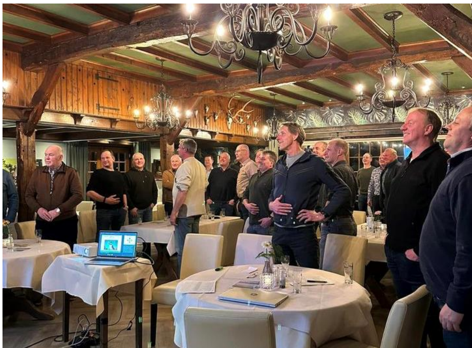
volle aandacht van de OVBO leden op de leerzame bijeenkomst