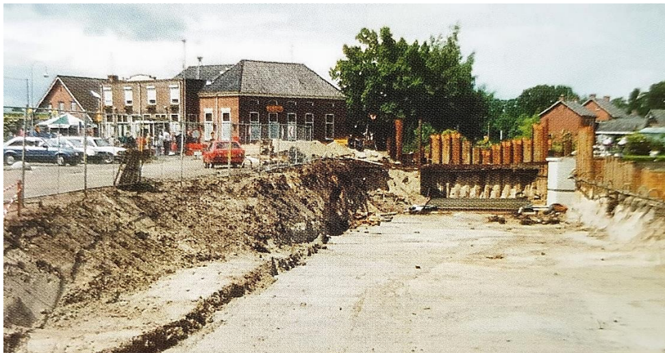
Aanbouw fiets/looptunnel onder de drukke Haaksbergerstraat in 1994