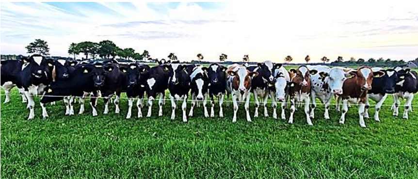
familie reünie!... zomerfoto - lekker gezellig buiten gemaakt

Beckum Beter Bekeken, jaargang 45, nummer 7 2023