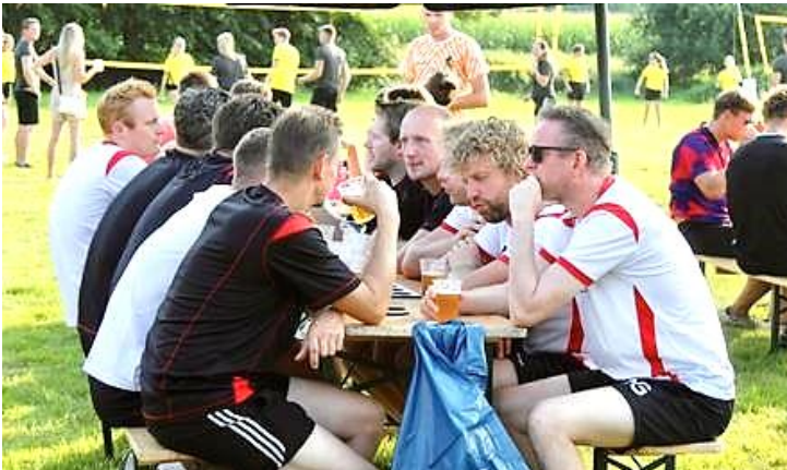
Volleybal (op de achtergrond...)