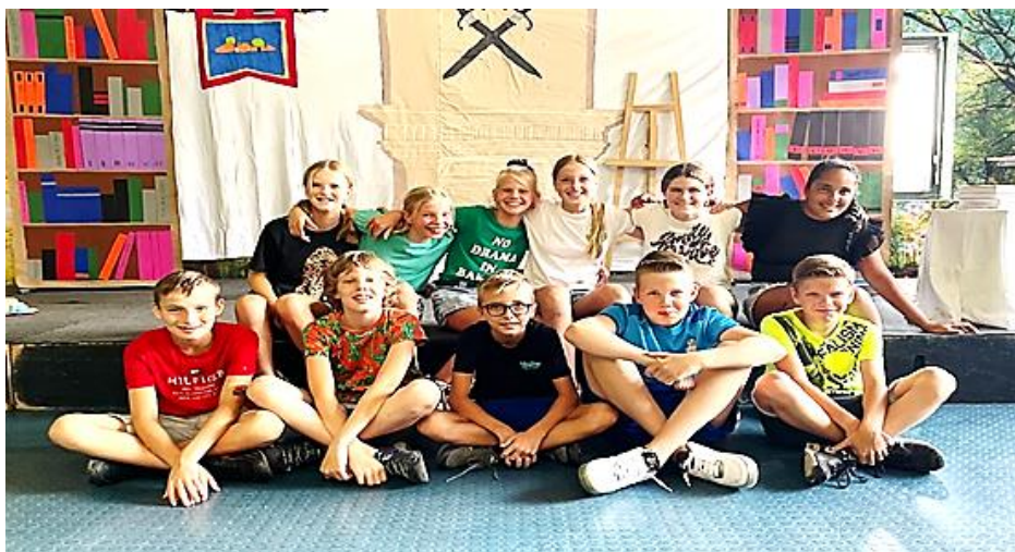
De kinderen van groep 8 voor het podium van de musical.