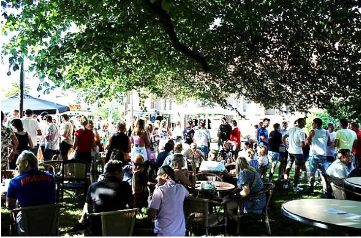
Bier-wijn party onder de bomen in de parochietuin