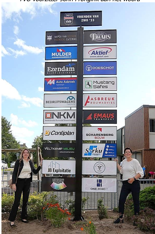
Het grote sponsorenbord werd onthult bij 't Meuken en eenzelfde bord is ook bij de Kruudnhof geplaatst