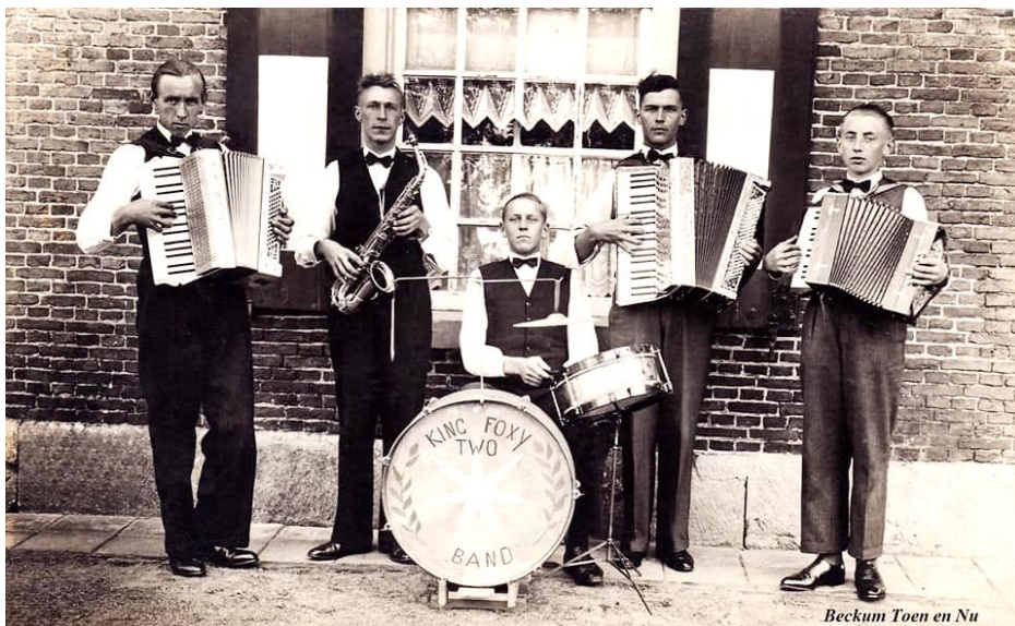
Beckum Toen en Nu