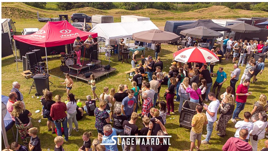
Overzicht Outdoor Cooking en optreden M'reen en Loes