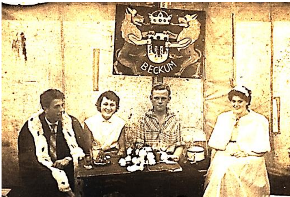
Foto vogelschieten uit 1955.