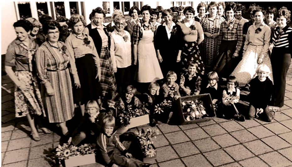
Deze Dames (Klaar-overs) zorgden ervoor dat de "jonge" jeugd dagelijks veilig de Haaksbergerstraat over kon steken. Foto uit 1979.