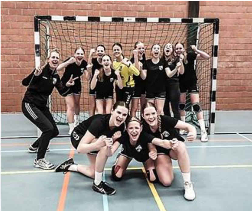
Handbal B-jeugd (BIJNA) KAMPIOEN!!!!