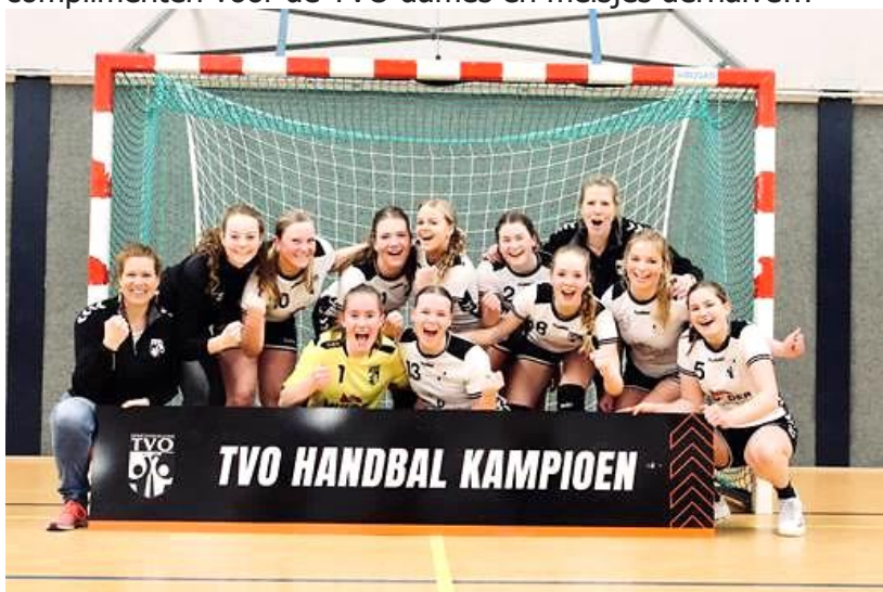
Het ongeslagen junioren kampioensteam TVO a1 handbal

En dan TVO handbal. Het succesvolle seizoen voor dames1 werd met een monsterzege op DHV afgesloten. Junioren A1 deden hier niet voor onder en met iets van 38-16 werd Combinatie weggevaagd. Zowel dames1 als junioren A1 werden ongeslagen kampioenen. Grote complimenten voor de TVO dames en meisjes derhalve!!!